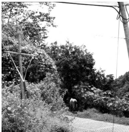
Figura 3 - Cruz a la salida del pueblo.