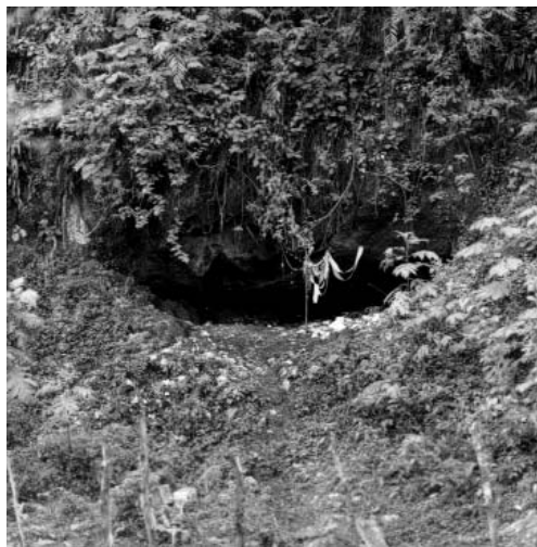
Figura 4 - Cueva de Youayan.