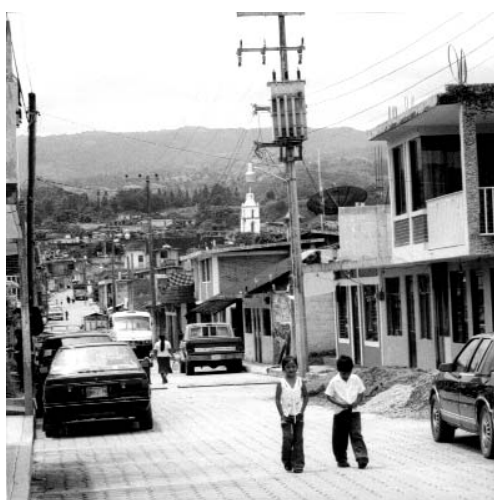
Figura 2 - Una calle de Cuacuila en 2006.

Con estos ejemplos se ve claramente que, en cuanto al consumo familiar, ya no mandan el mundo rural, la ferocidad de la naturaleza, los valores de frugalidad antes tradicionales en esta zona, las habilidades artesanales domésticas y las exigencias de la agricultura. Domina el mundo urbano, cierta ostentación en el consumo y la invasión de los productos del mercado mundial.