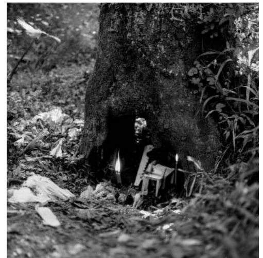
Figura 5 y 6 - Ofrendas al árbol Sialpana.